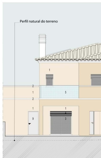
REQUERENTE - LOTE 11 ALÇADO P