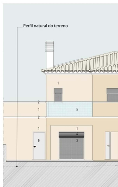
REQUERENTE - LOTE 11 ALÇADO P